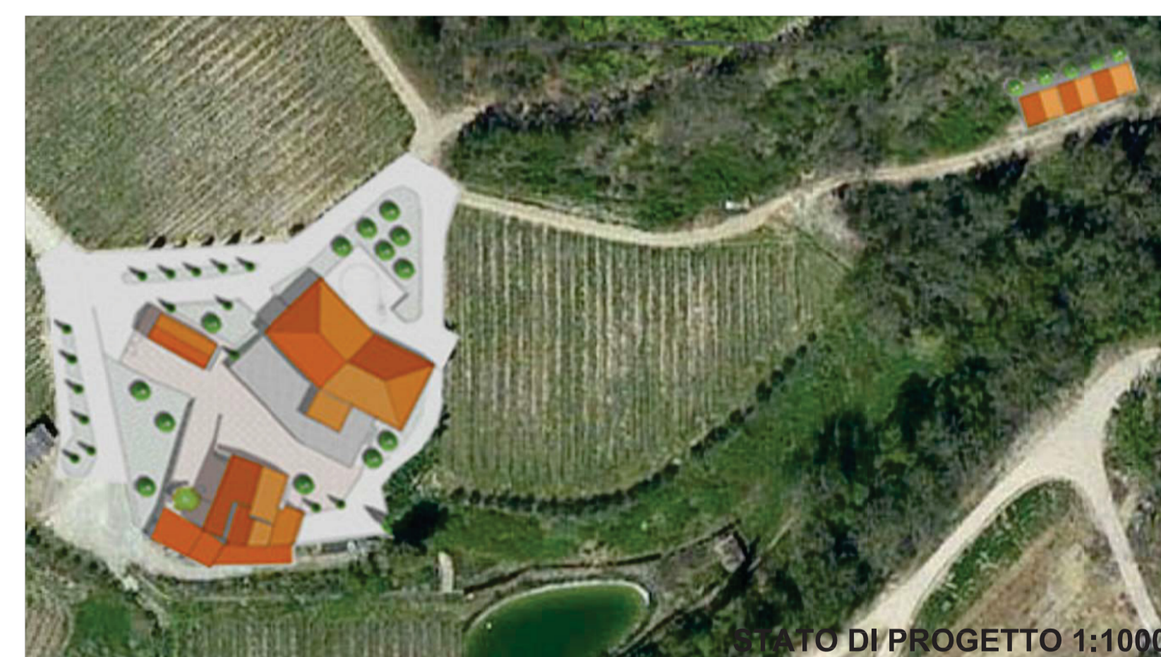
STATO DI PROGETTO 1:1000