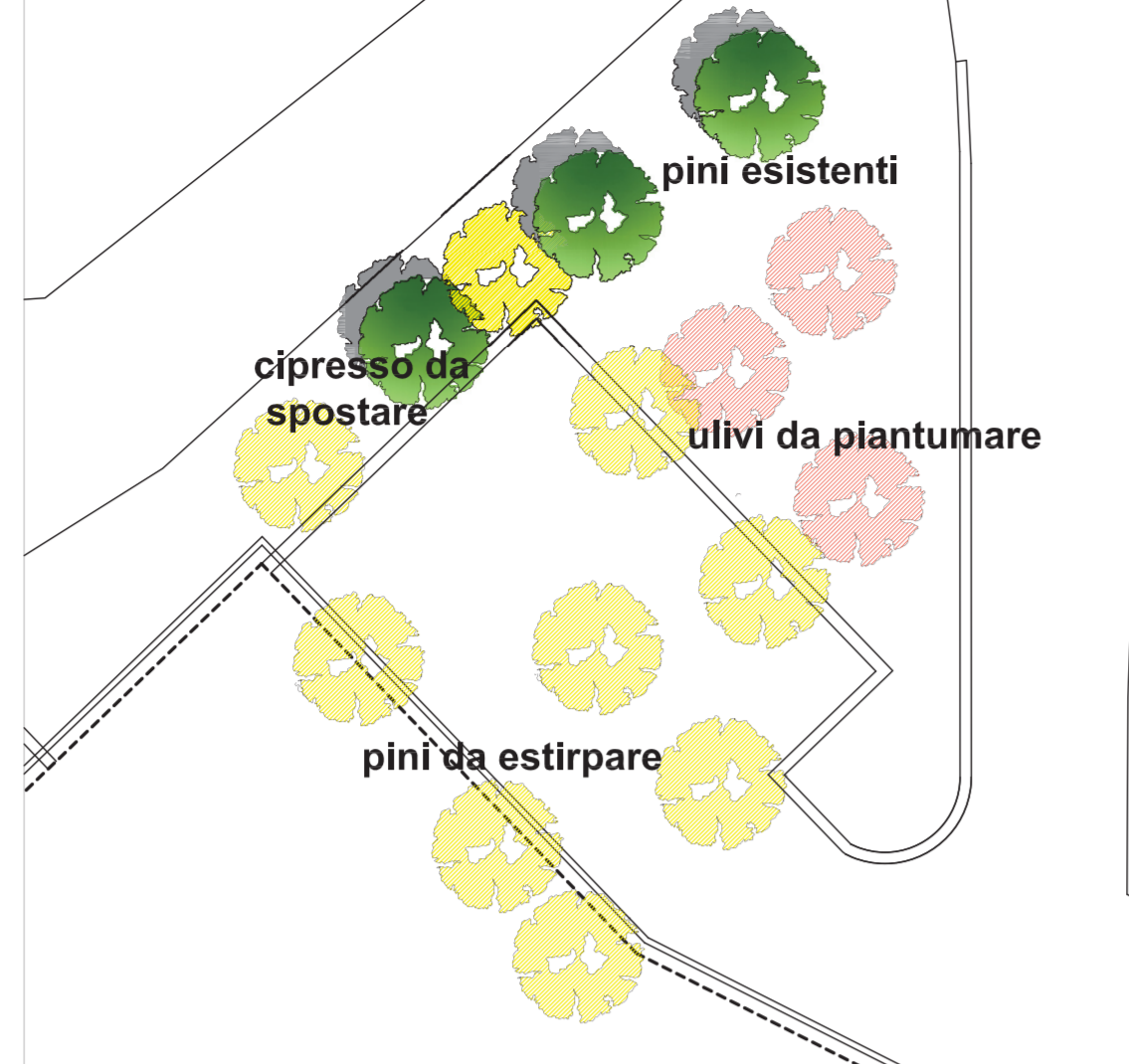
STATO DI RAFFRONTO 1:200