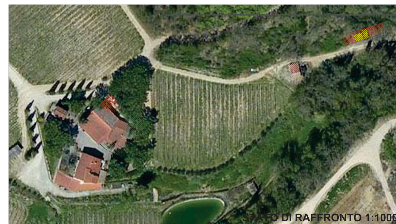
STATO DI RAFFRONTO 1:1000

COMUNE DI SAN CASCIANO VAL DI PESA Provincia di Firenze