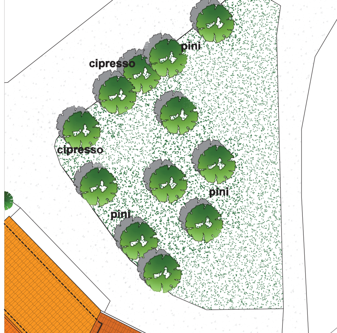
STATO ATTUALE 1:200